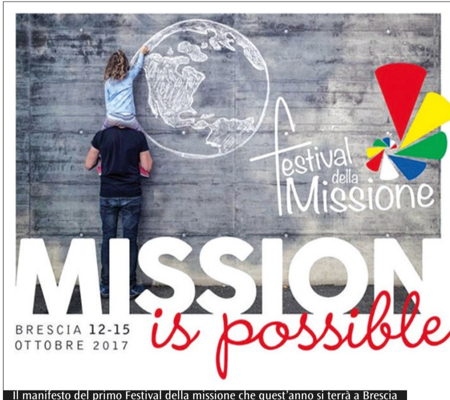
Il manifesto del primo Festival della missione che quest'anno si terrà a Brescia