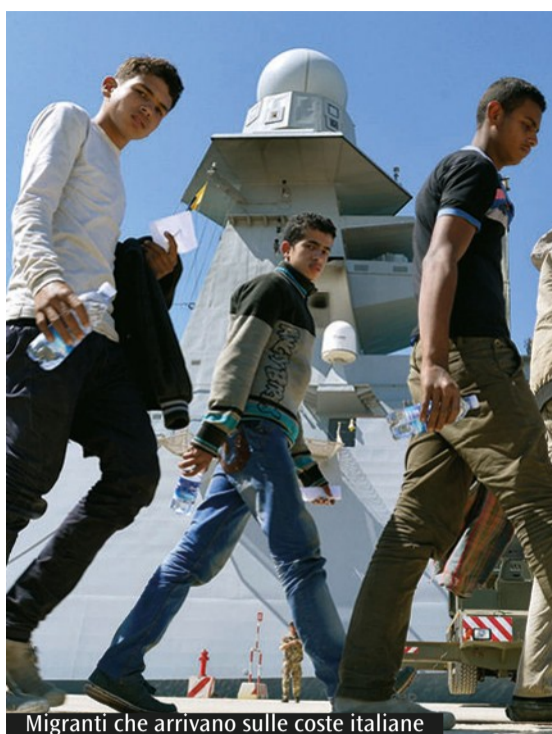
Migranti che arrivano sulle coste italiane